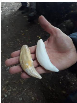
Blanchiment express d'une dent d'ours de la grotte de Cotencher !

Timidement mais sûrement, les Sites du mois souhaitent inclure la technologie 3D et permettre à tout un chacun d'imprimer des « clones » d'objets archéologiques.